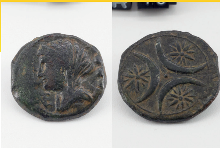
Moneta di epoca romana