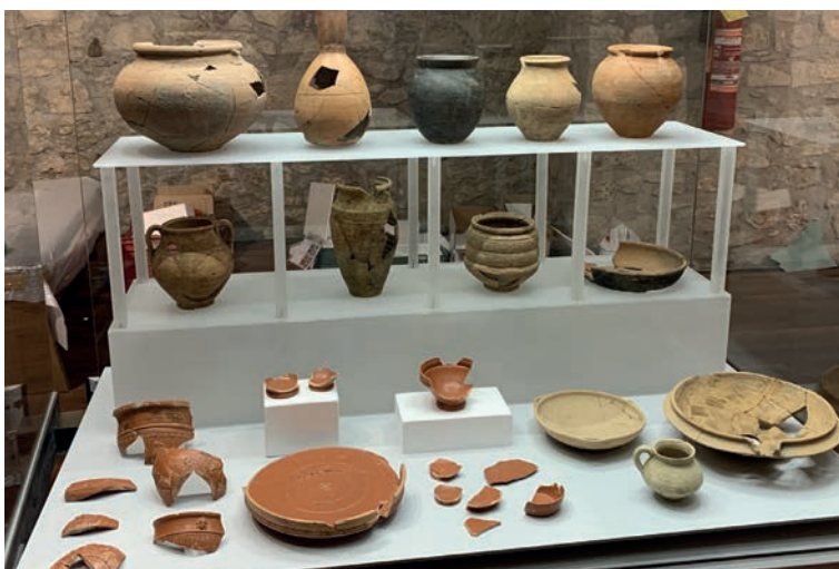
Ceramiche di uso quotidiano