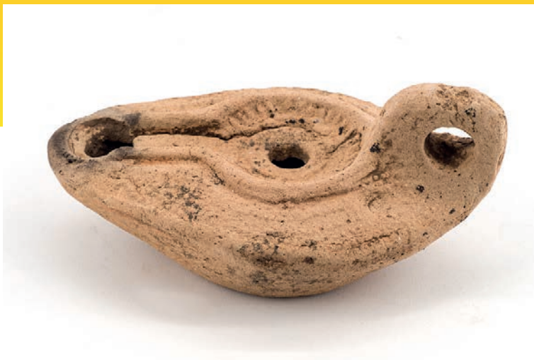
Lucerna del II secolo