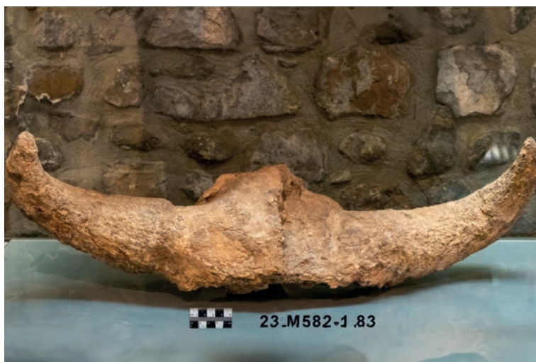
Corna di bisonte preistorico