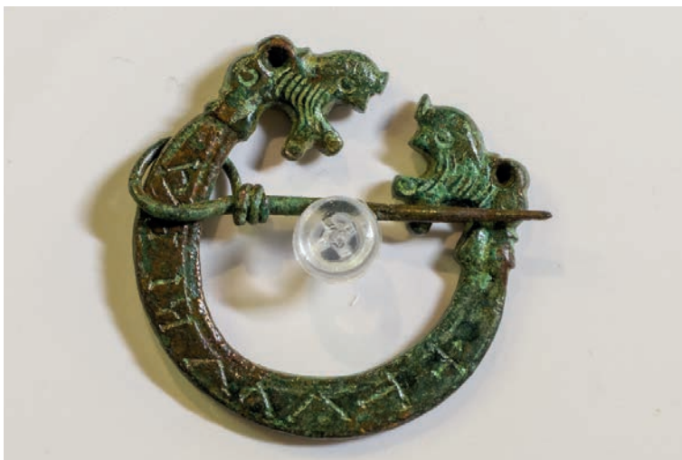
Fibula (spilla) in bronzo